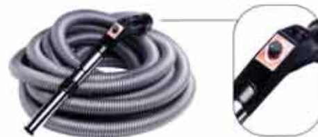
Elektro-Saugschlauch AP 232, 8m; AP 237, 9m nur in Verbindung zu Art. NA 606

Mit dem am Griff des Schlauchs angebrachten elektronischen Leistungsregler „Power Control“ können Sie die Saugleistung Ihrer „Staubsauganlage PERFETTO“ nach Belieben regulieren. Dieses exklusive System ermöglicht eine optimale Benutzung mit einer spürbaren Verminderung des Stromverbrauchs.